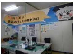
センターです。ここで、電話相談やメール相談を受けています。