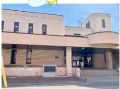
青森市総合福祉センター2階です。