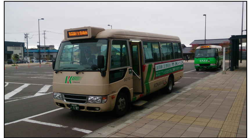
昨年度の社会実験

広報あおもり9月15日号、毎戸配布のチラシ、バス車両・バス停、ホームページでの周知