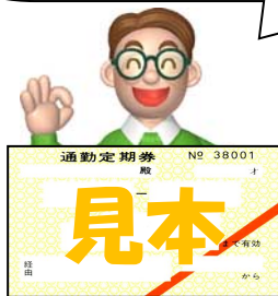
(通勤定期券所持者)