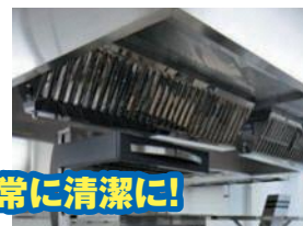
厨房設備は常に清潔に!

清掃、必要な点検及び整備など厨房設備の維持管理は「火災予防条例」で義務づけられています。