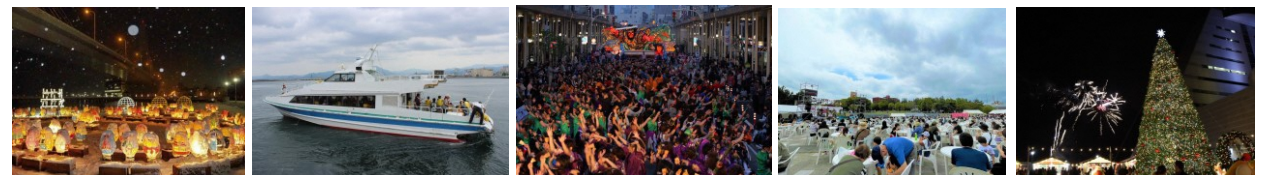
画像：各種団体が青森港周辺で催す様々なイベント

主な記念日 フェーズ1:令和7年5月15日(木) フェーズ2:令和8年4月6日(月)