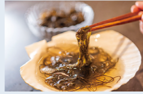
이마베쓰마치의 '바위 큰 실말'로 사부사부

무쓰만 음식의 매력을 일망타진. 아오모리시를 기점으로 쓰가루 반도를 북상, 시모키타 반도로 건너가 고퀄리티의 무쓰만 음식을 음미하며 당신 취향의 요리를 장만하기 하는 포리지(식재료 조달)여행.