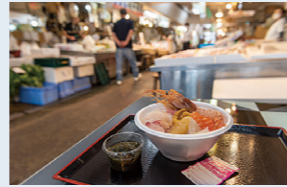
아오모리시의 '늦게동'을 음미