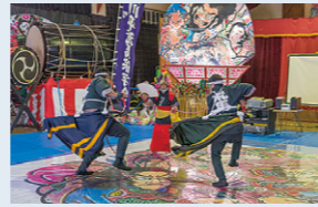
이마베쓰마치의 '아라우마' 체험