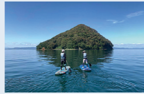
아오모리 시내의 해변에서 SUP 체험

무쓰만의 매력을 즐길 수 있는 정석 코스. 시모키타 반도&쓰가루 반도의 미식과 절경을 헌팅. 아오모리시를 기점으로 무쓰만을 일주. 각지의 관광 명소를 방문하며 무쓰만의 해산물을 중심으로 각지의 미식을 맛보는 여행.