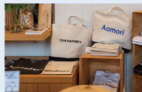
아오모리시의 'A-FACTORY'에서 쇼핑