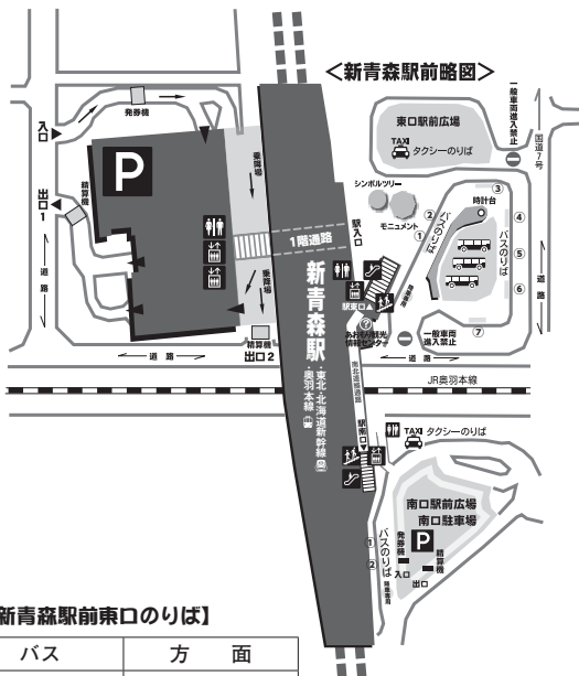
【新青森駅前東口のりば】