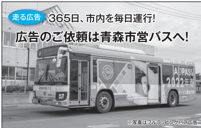
※写真はフルラッピングバス広告