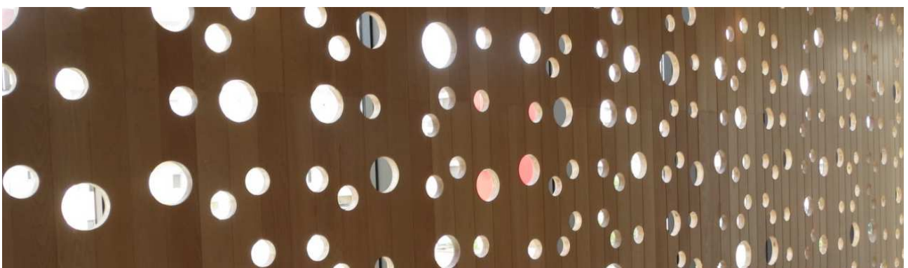
青森市民美術展示館