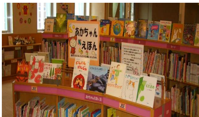
児童ライブラリー