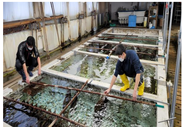
水産振興センターにおける種苗生産

ナマコ、ワカメ等は、本市の漁業生産において重要な魚種であるため、今後も種苗の安定生産に努めてまいります。