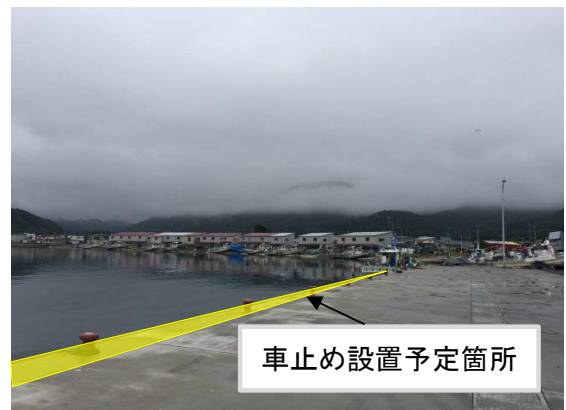
車止め設置予定箇所

県から市への漁港管理の移管後には、漁港施設の占用許可や、補修並びに維持管理等を市が行うこととなるため、漁業関係者のご意見を伺いながら、移管後の維持管理等を適切に行ってまいります。