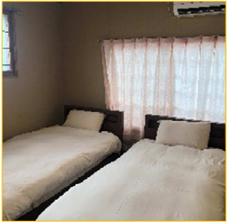
全室ベットルーム