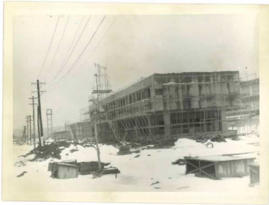
管理棟 (昭和47年1月頃)