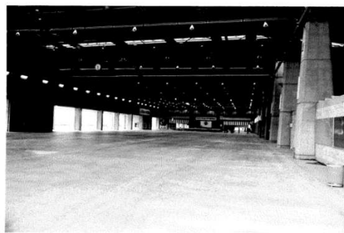
稼働直前の卸売場内 (昭和47年秋)