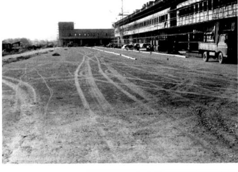
市場棟（手前）・水産冷蔵庫（奥） （昭和46年10月頃）