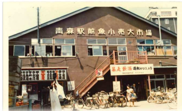
「豊富な品揃え」が売りの青森駅前魚小売大市場