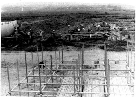
根切工事 （昭和46年7月頃）