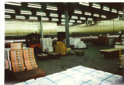
水産物低温卸売場完成／稼働② (平成5年)