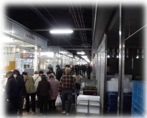
市場開放デー④（令和元年） 「水産仲卸店舗」