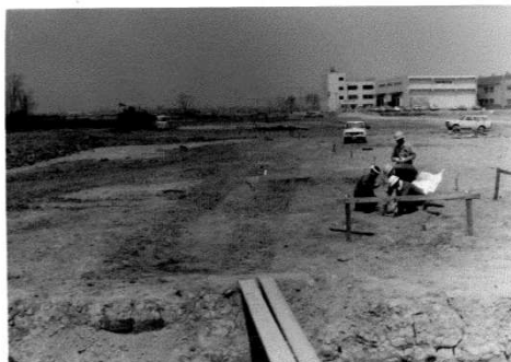
着工開始直後 （昭和46年6月頃）