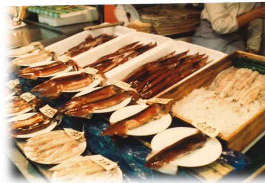
新鮮なイカがずらり！！