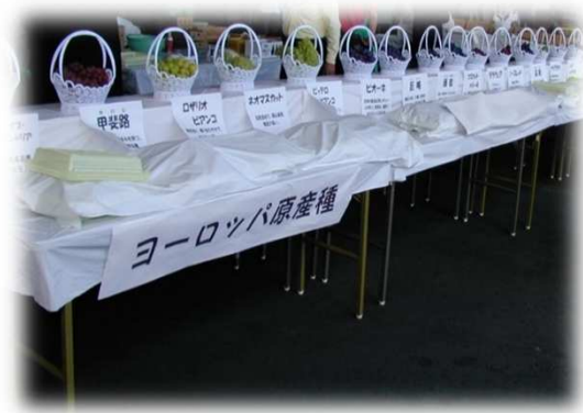
開設30周年記念市場まつり①/② (平成14年) 「青果ブースのにぎわい/世界のブドウを紹介」