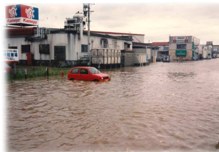
場内浸水② (平成2年10月の大雨)