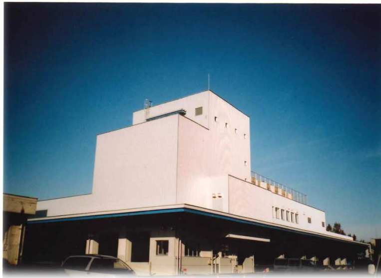
新水産冷蔵庫棟完成 (平成16年2月頃)