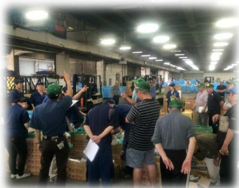
青果のせり (平成27年頃)