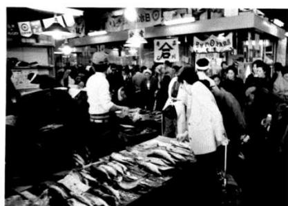
にぎわう仲卸売場①/②