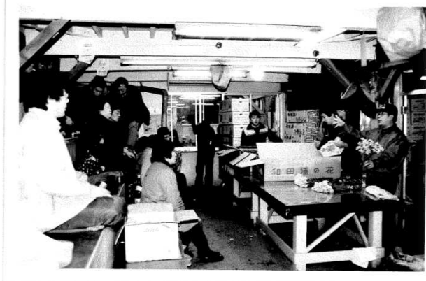
花き部の様子 (整備工事以前)