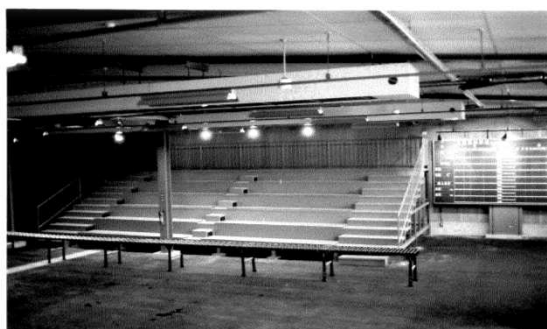
花き部完成 (昭和63年頃)