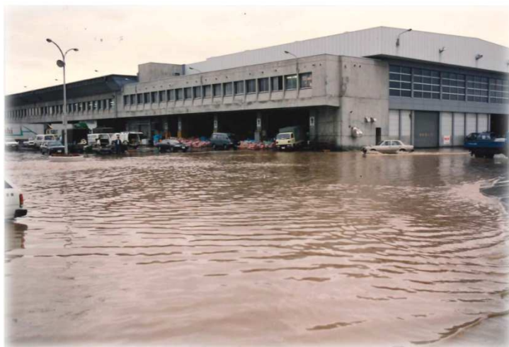
場内浸水① (平成2年10月の大雨)