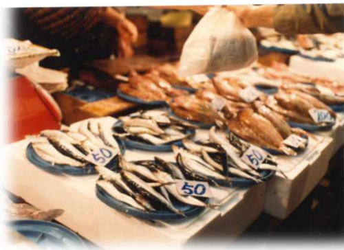
とれたてイワシが一皿50円！