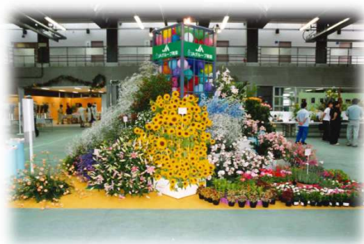
改築記念市場まつり①／②（平成12年7月頃） 「青森県産の花展」