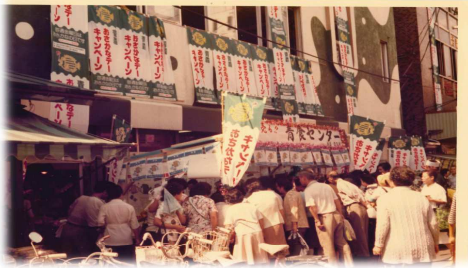
卸売市場開場後の青森駅前古川周辺 (写真は、おさかなデーキャンペーン中の様子)