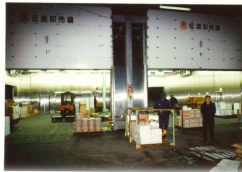
水産物低温卸売場完成／稼働① (平成5年)