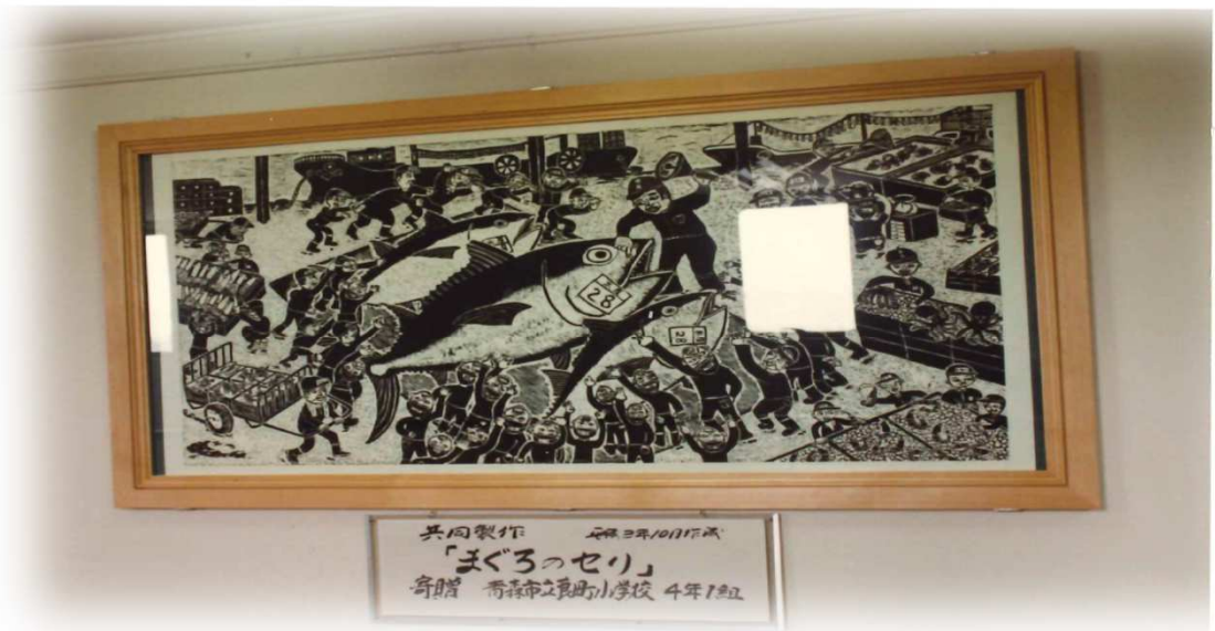
木版画（寄贈） (青森市立莨町小学校4年1組の皆さんによる共同製作：平成3年10月) (現在、当市場管理棟2階廊下に展示中)