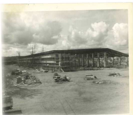
市場棟（鉄骨・大梁・架構） （昭和46年11月頃）