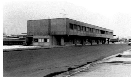
市場管理棟完成 (昭和47年春)