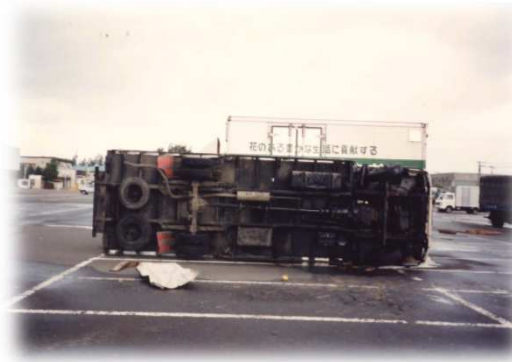
台風による被害③ (平成3年9月：台風19号)