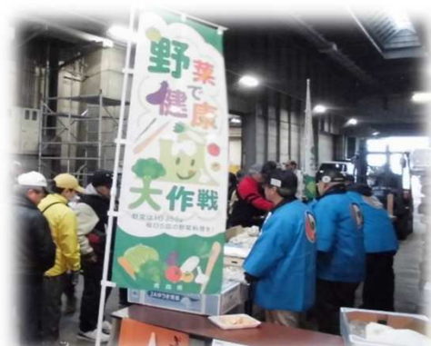
市場開放デー⑤（令和元年） 「青果直販ブース」