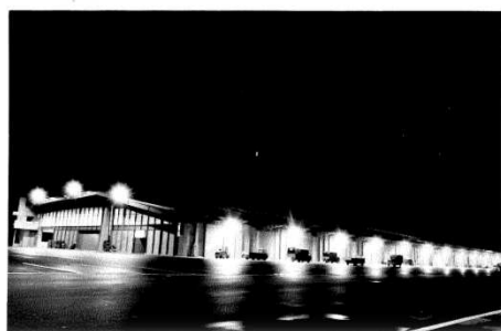
夜中から未明の卸売市場