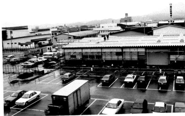
花き部整備工事① (昭和62~63年)