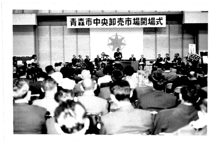
開場式典 (水産物部：昭和47年秋)