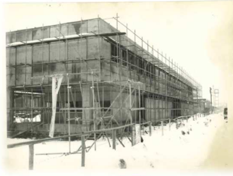
管理棟 (昭和47年1月頃)