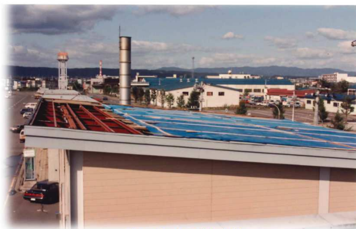
台風による被害① (平成3年9月：台風19号)