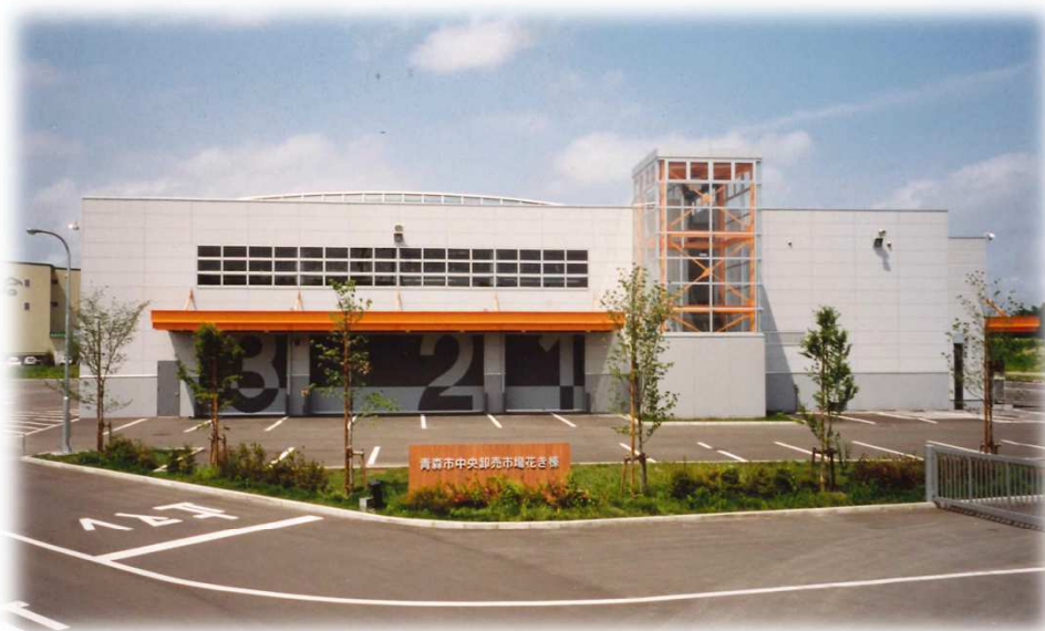
新花き棟完成／稼働 （平成12年7月頃）