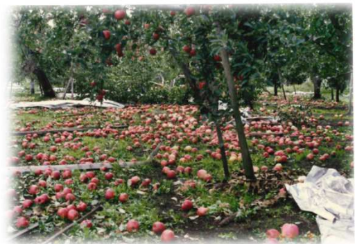
その他の被害⑤ (平成3年9月：台風19号)