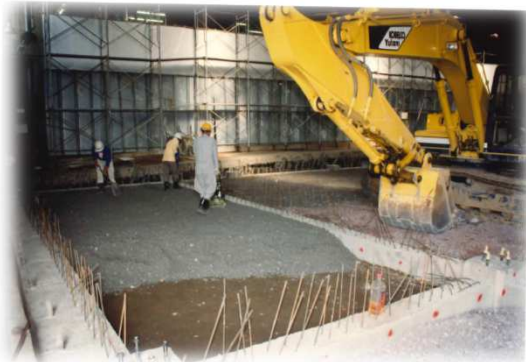
水産物低温卸売場整備工事③ (平成4年)