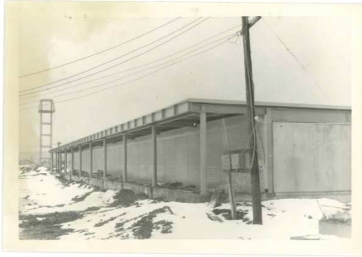
東側関連事業者店舗棟完成 (昭和46年11月頃)