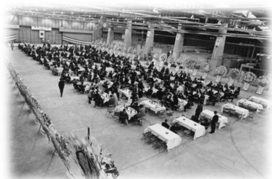
開場式典 (青果部：昭和47年秋)