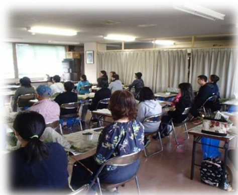
市場開放デー②（令和元年） 「フラワーアレンジメント教室」