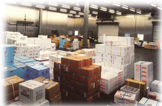
水産物低温卸売場完成／稼働③ (平成5年)