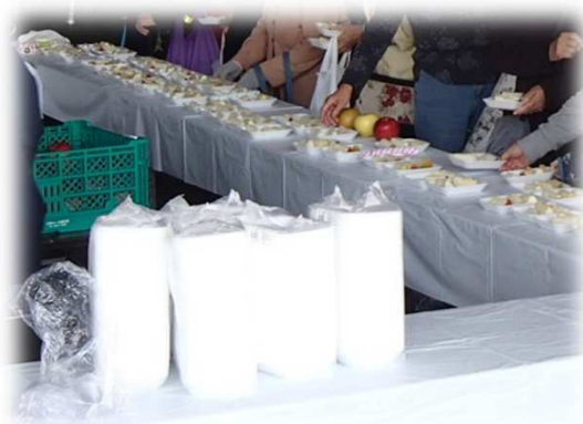
市場開放デー① (令和元年) 「青果物 (リンゴ・梨) の振る舞い」