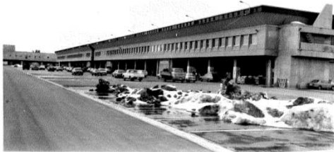
市場棟完成 (昭和47年春)