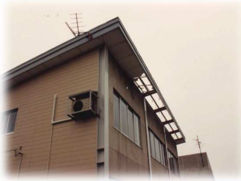
台風による被害② (平成3年9月：台風19号)