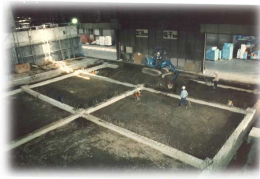
水産物低温卸売市場整備工事② (平成4年)