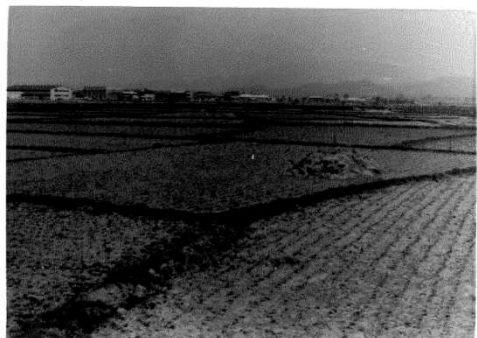
着工前の周辺 （昭和45年4月頃）