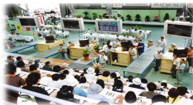
改築記念市場まつり③（平成12年7月頃） 「花きのせり体験」