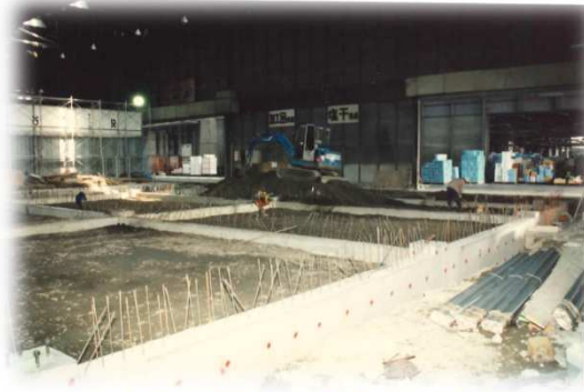
水産物低温卸売場整備工事① (平成4年)