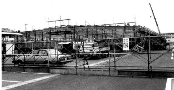
花き部整備工事② (昭和62~63年)