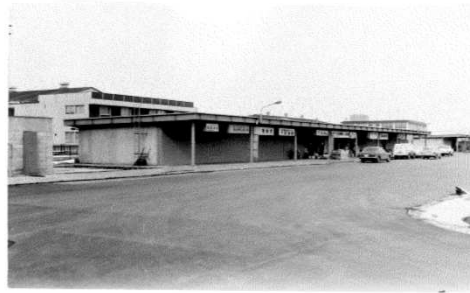
西側関連業者店舗棟完成 (昭和47年春)