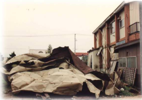
台風による被害④ (平成3年9月：台風19号)