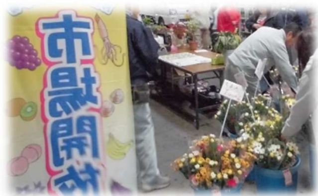
市場開放デー⑥（令和元年） 「花木の販売ブース」