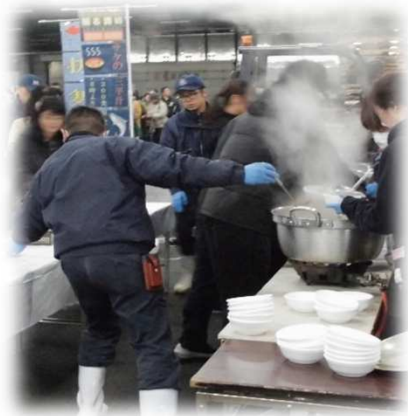
市場開放デー③（令和元年） 「水産物（三平汁）の振る舞い」