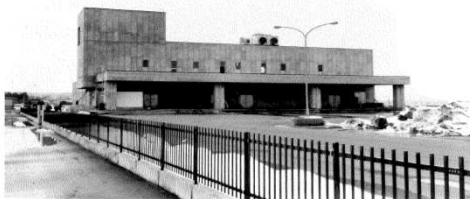
水産冷蔵庫棟完成 (昭和47年春)