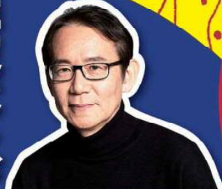
周防 正行 映画監督