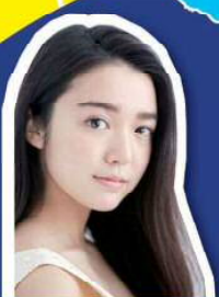
上白石 萌音 主演女優