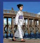
百日紅 ~Miss HOKUSAI~ 10:00～