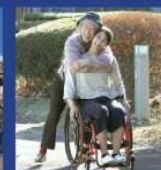
マンゴーと赤い車椅子 13:00～