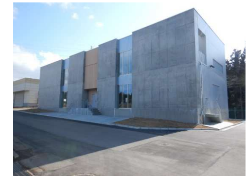
横内浄水場紫外線処理施設の導入（R3年度）