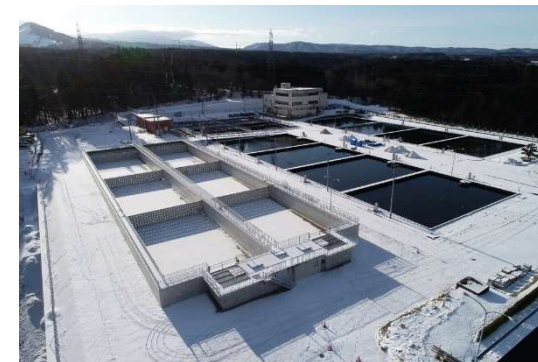
横内浄水場北系沈殿池の耐震化（R2年度）