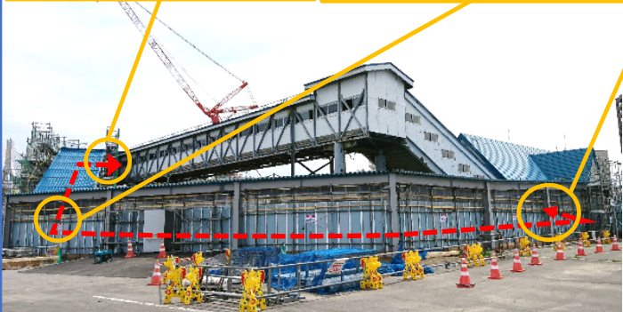
乗換えご線橋の仮通路の切替え（青森駅西口）