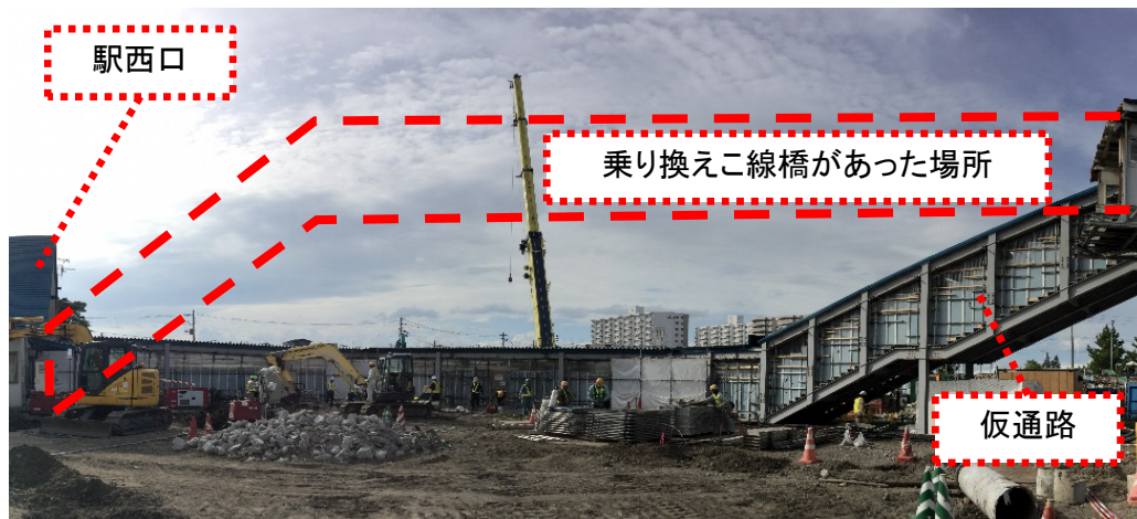
乗り換えこ線橋の撤去完了（青森駅西口）

※ 青森駅周辺で行われる連携イベントの一つ「青森駅まつり」の一環として、 10月13日（日）（①10時～、②13時～（各回先着30名））に、青森駅自由通路等の工事見学を行います。