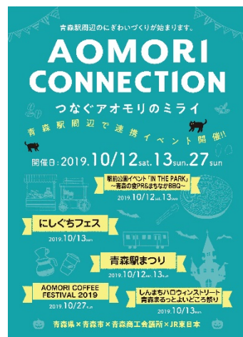
青森駅周辺での連携イベントの開催