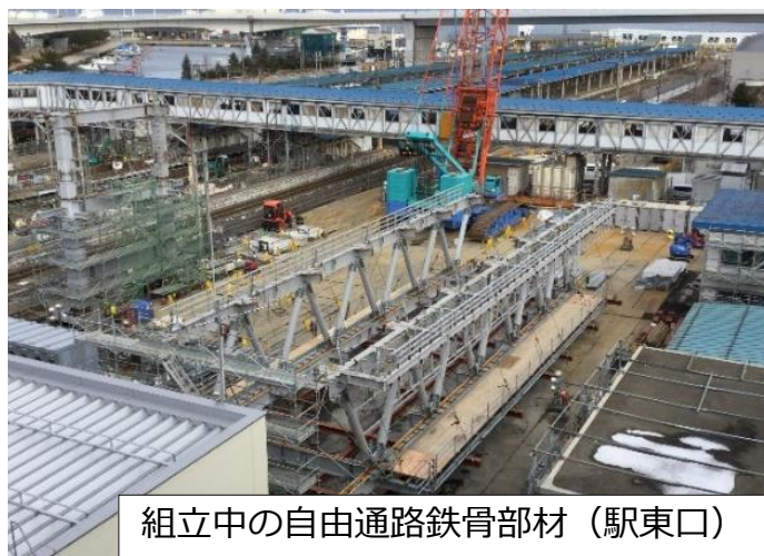
組立中の自由通路鉄骨部材（駅東口）