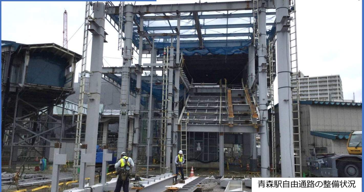
青森駅自由通路の整備状況