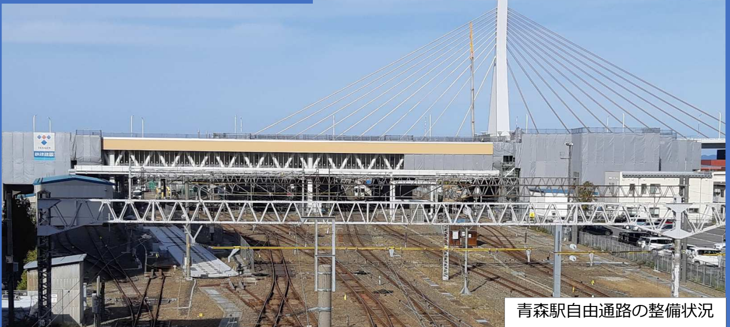
青森駅自由通路の整備状況