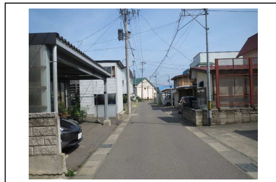
⑩から撮影した写真