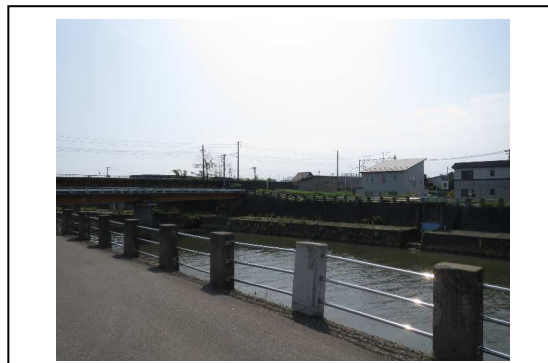
⑨から撮影した写真