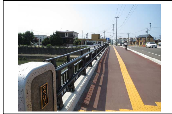
②から撮影した写真