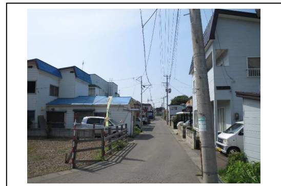
⑪から撮影した写真