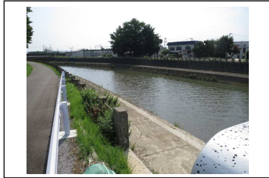
①から撮影した写真