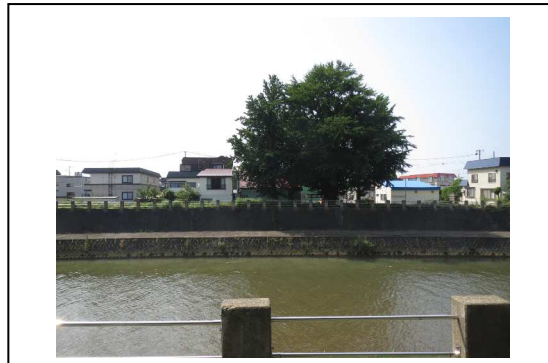
⑦から撮影した写真