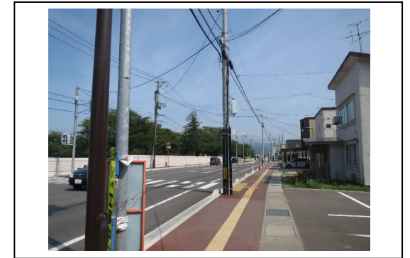
⑥から撮影した写真