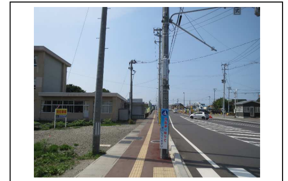
⑧から撮影した写真