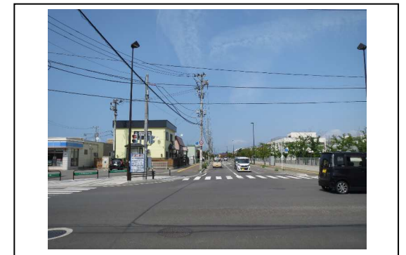
④から撮影した写真