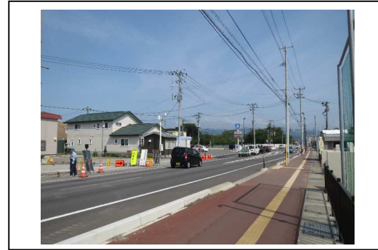
③から撮影した写真