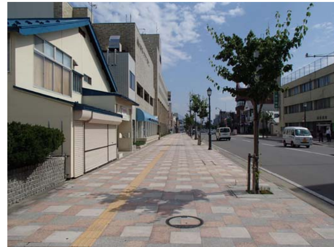
⑤から撮影した写真