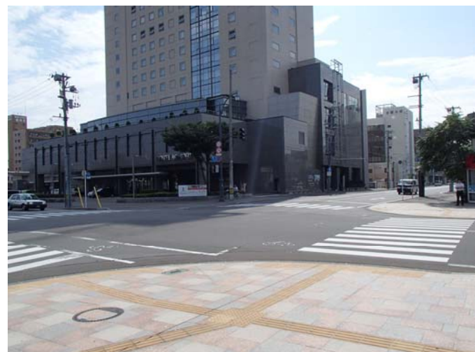
④から撮影した写真