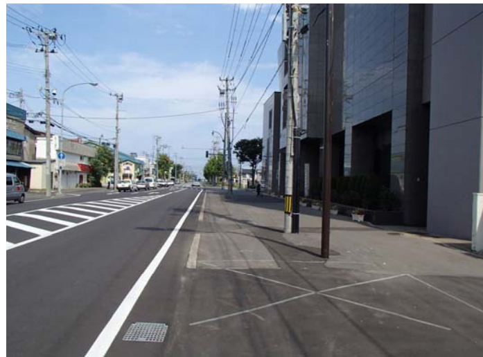
②から撮影した写真