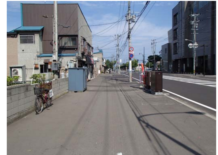
③から撮影した写真