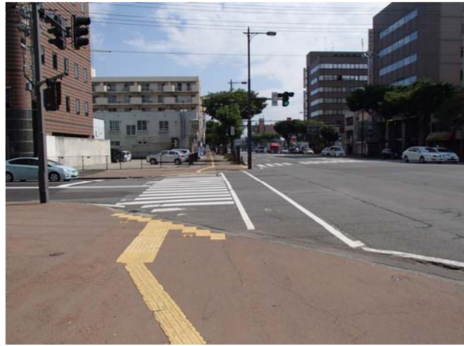
①から撮影した写真