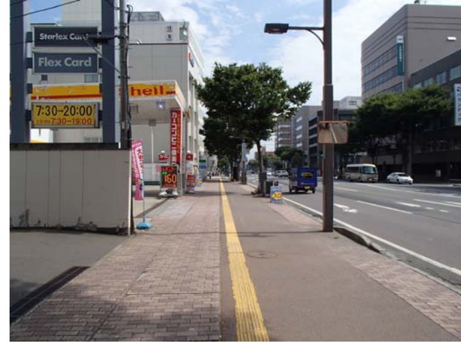
⑥から撮影した写真