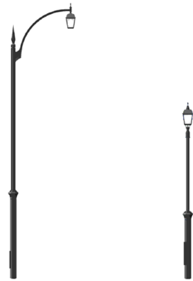
【車道用照明灯】 【歩道用照明灯】

整備方針：車道部…局部照明（交差点等） 歩道部…連続照明（水平面照度 3Lx以上を確保） ※JIS Z 9111道路照明基準より