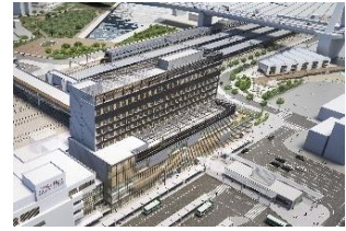
パースはイメージです。 実際とは異なることがあります。